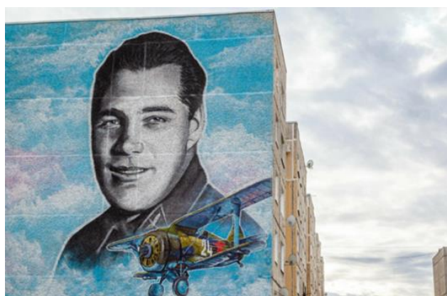
Рисунок на стене дома по улице Каляева

Улица протяженностью 1840 метров. Застроена преимущественно двухэтажными жилыми домами. На торце здания Северного педагогического колледжа размещена мемориальная доска с профилем Анатолия Серова и текстом: «Проспект назван в честь Героя Советского Союза легендарного летчика Анатолия Константиновича Серова 1910-1939 г.г.». Рядом с профилем летчика изображение Золотой Звезды. Табличка в нынешнем виде была установлена в 2025 году. Предыдущая была установлена в 1990 году [5]