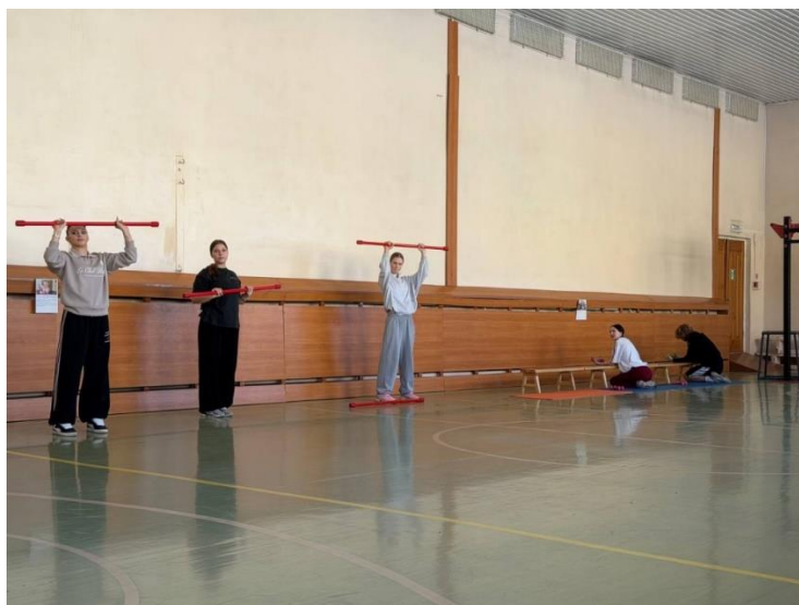
Рис.3. Третья и четвертая станция круговой тренировки

Завершающим этапом занятия стала рефлексия. Учащимся было предложено ответить на вопросы, информация по которым им была дана в ходе всего занятия.