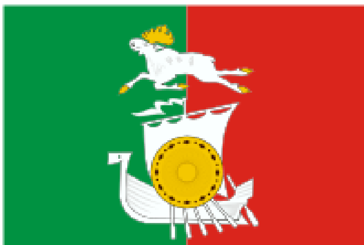
Герб Тавдинского городского округа