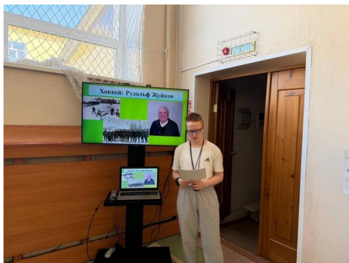
Рис.1 Теоретический блок «Галерея славы серовского спорта»