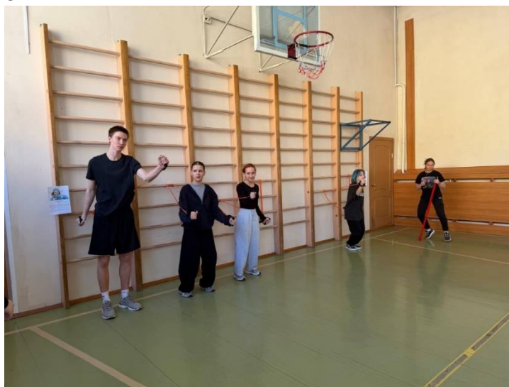
Рис.2. Первая и вторая станция круговой тренировки

Практическая часть была организована в формате круговой тренировки, состоящей из 6 станций. Каждая станция символически и физически соответствовала виду спорта, представленному в теоретическом блоке, и была посвящена конкретному спортсмену и его виду спорта. Рис. 2, рис.3.