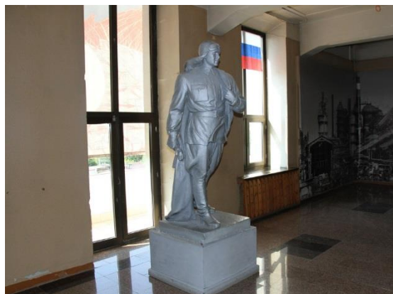
Скульптура Анатолия Серова (Дворец культуры металлургов)

Скульптура Анатолия Серова установлена в 1975 году в фойе малого зала Дворца культуры металлургов. Скульптор изобразил летчика в полный рост. Сейчас статуя стоит на втором этаже ДКМ, напротив входа в большой зал [1].